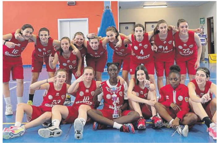
Le ragazze dell'Assigeco Ladies under 14 festeggiano la vittoria