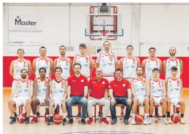
Il Piacenza Basket Club e, a sinistra, il messaggio di Guastalla