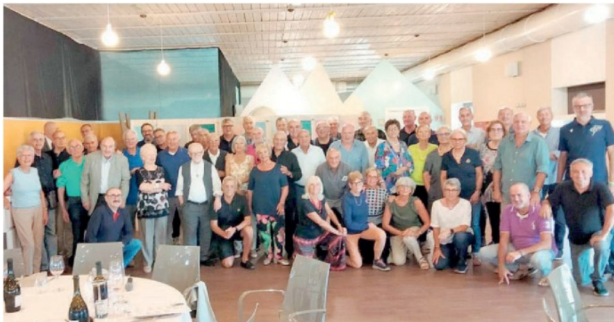
Tantissimi alla festa Il folto gruppo dei partecipanti all'adunata.