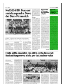
Nel 2024 Bif Burzoni sarà la squadra Devo del Dm-Firmenich