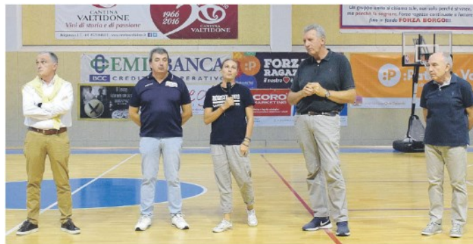
Al palazzetto comunale, oltre ai cento tesserati del Basket Borgonovo, sono intervenuti dirigenti, autorità e familiari degli atleti. La squadra si appresta ad iniziare la 52esima stagione sportiva

ARTICOLO NON CEDIBILE AD ALTRI AD USO ESCLUSIVO DEL CLIENTE CHE LO RICEVE - 6318