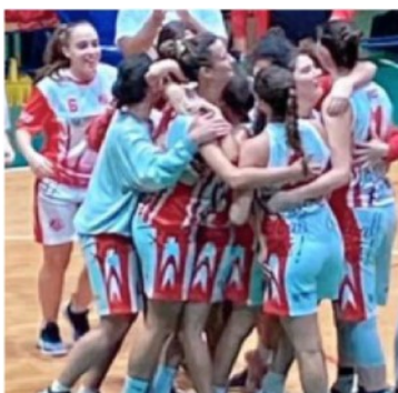
La Libertas Rosa festeggia la vittoria