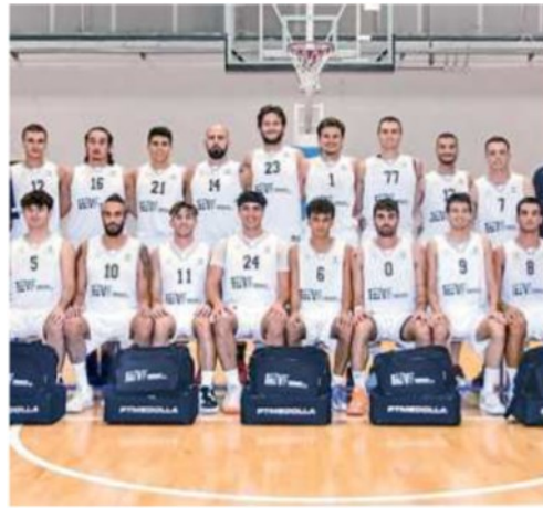
VF Group Medolla

Bel successo per la formazione di coach Duca che si è imposta sul parquet della Tecnofondi Carpi