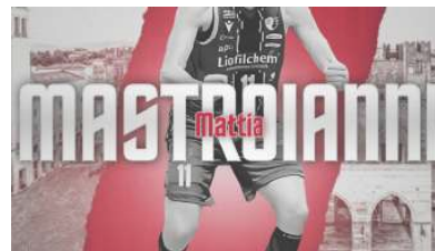
Bakery, annunciati Mastroianni e Soviero

La serie A dei giovani sbarca a Piacenza Ce la porta il Bakery, che iscrive la sua Under 20 nella Divisione Nazionale Giovani, in pratica il top in Italia a livello juniores. Per ritrovare qualcosa di simile a Piacenza bisogna salire sulla macchina del tempo e farsi un