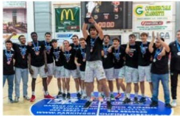
L'Under 19 Gold campione regionale

La Raggisolaris Academy è entrata nell'élite della pallacanestro nazionale giovanile. La società faentina parteciperà infatti nella stagione 2024/25 all'Under 19 Eccellenza, il massimo campionato italiano a livello giovanile, dove militano tutte le maggiori società. Un traguardo