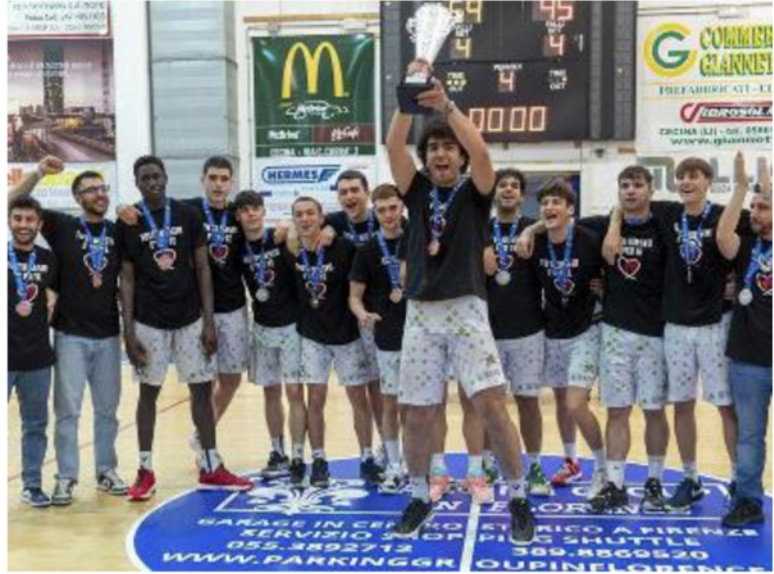
Il momento più bello: quando si solleva la coppa