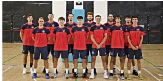
I ragazzi del Bologna 2016 che per la seconda volta di fila faranno la B Interregionale

«Ci prepareremo per più di un mese. Ci piace molto l'idea che le persone che simpatizzano per noi, che ci vedranno via web o che verranno al PalaSavena, possano godere di uno spettacolo divertente: abbiamo fatto la scelta di giocare di domenica, sperando di essere compatibili con gli impegni di molti».