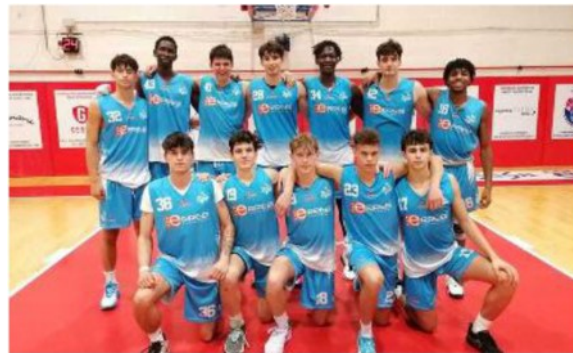
La Vis under 19 va a caccia del secondo successo dopo il debutto convincente sul campo di Empoli

IL TURNO: One Team Forlì-Etrusca San Miniato, Vis 2008 Ferrara-Raggisolaris Academy Faenza, Pino Dragons Firenze-Victoria Libertas Pesaro, Bsl San Lazzaro-Pistoia Basket, Virtus Bologna-Basket Santarcangelo, Firenze Basketball Academy-Virtus Siena, Pallacanestro Don Bosco-Basket Biancorosso Empoli. CLASSIFICA: Vis 2008 Ferrara, Bsl San Lazzaro, One Team Forlì, Raggisolaris Academy, Pistoia Basket, Virtus Bologna, Pallacanestro Don Bosco 2 punti; Etrusca San Miniato, Vuelle Pesaro, Pino Dragons Firenze, Firenze Basketball Academy, Basket Santarcangelo, Virtus Siena, Basket Empoli 0 punti.