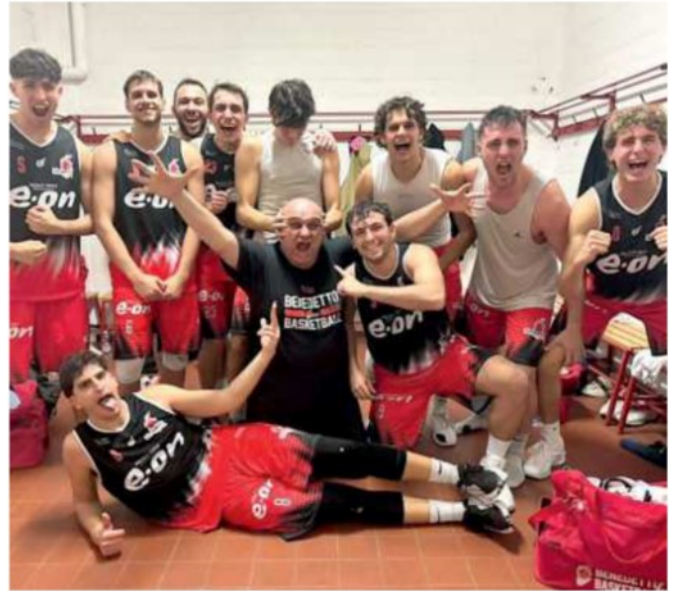
La foto dopo la vittoria a Bologna: è ormai prassi per la Benedetto 1964