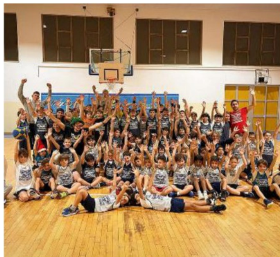
Foto di gruppo al termine della festa del minibasket