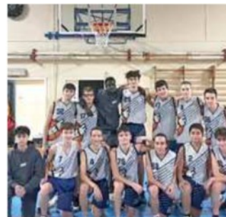
L'under 15 del Gallo I padroni di casa protagonisti

Oggi, con palla a due alle ore 15, Benedetto 1964 Cento e Scuola Basket Ferrara si affronteranno nella prima delle due semifinali per il tabellone dal 5° all'8° posto. Alle 17 toccherà alle perdenti delle altre due gare della prima giornata, mentre le semifinali per il tabellone dal 1° al 4° posto andranno in scena alle ore 19 e alle 21. Domani, le finali: alle 11 per il 7-8° po-