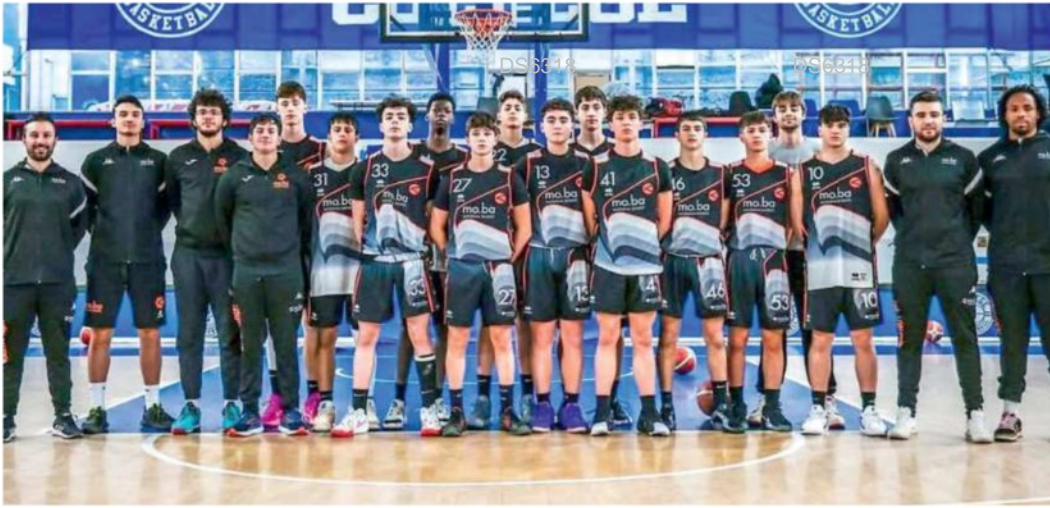
Nelle foto/1 Nello scatto in alto la squadra Under 17 della Mo.Ba che ha chiuso al quinto posto il gruppo G della EYBL