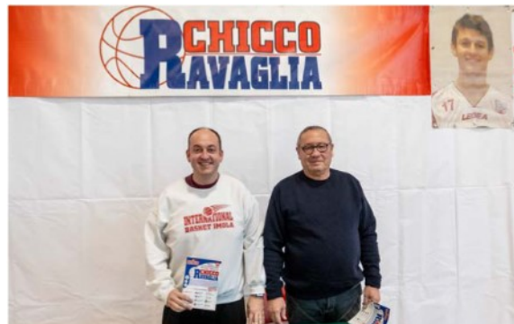
Un momento della presentazione del torneo