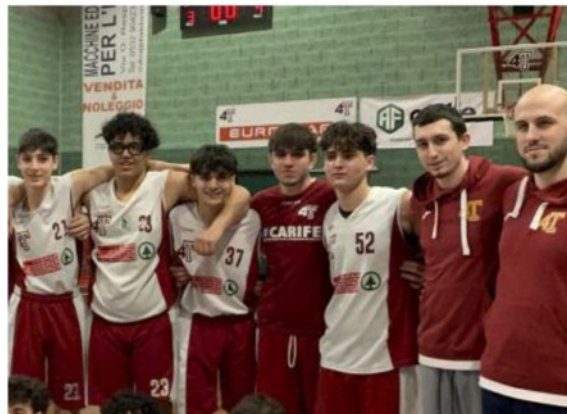
L'evento è organizzato dalla 4 Torri. Campi di gioco, Pala Aeffe e Pala Palestre