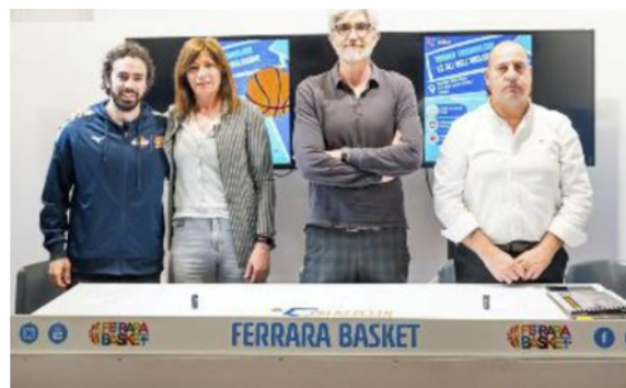
La presentazione svoltasi ieri mattina