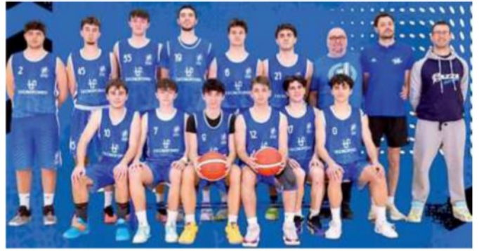
Sopra la prima squadra della Nazareno che ha conquistato la salvezza di Divisione Regionale 2, a destra l'Under 19 che va alle finali di Coppa Primavera