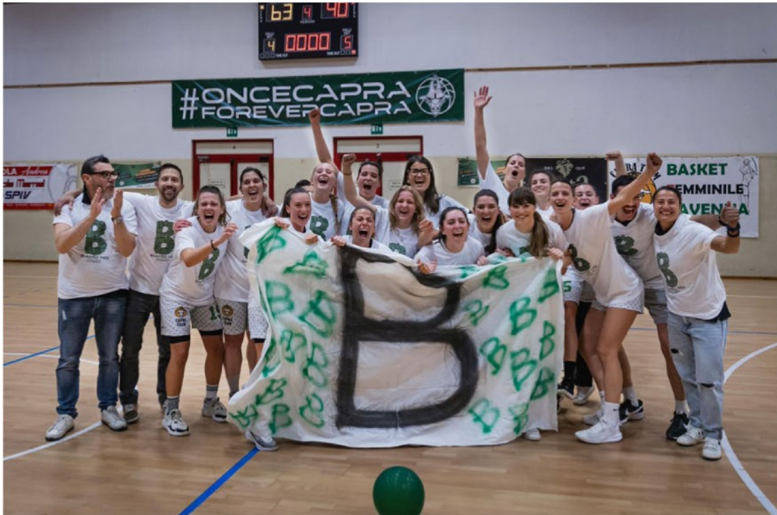
Le ragazze del Capra Team Ravenna festeggiano la promozione in Serie B