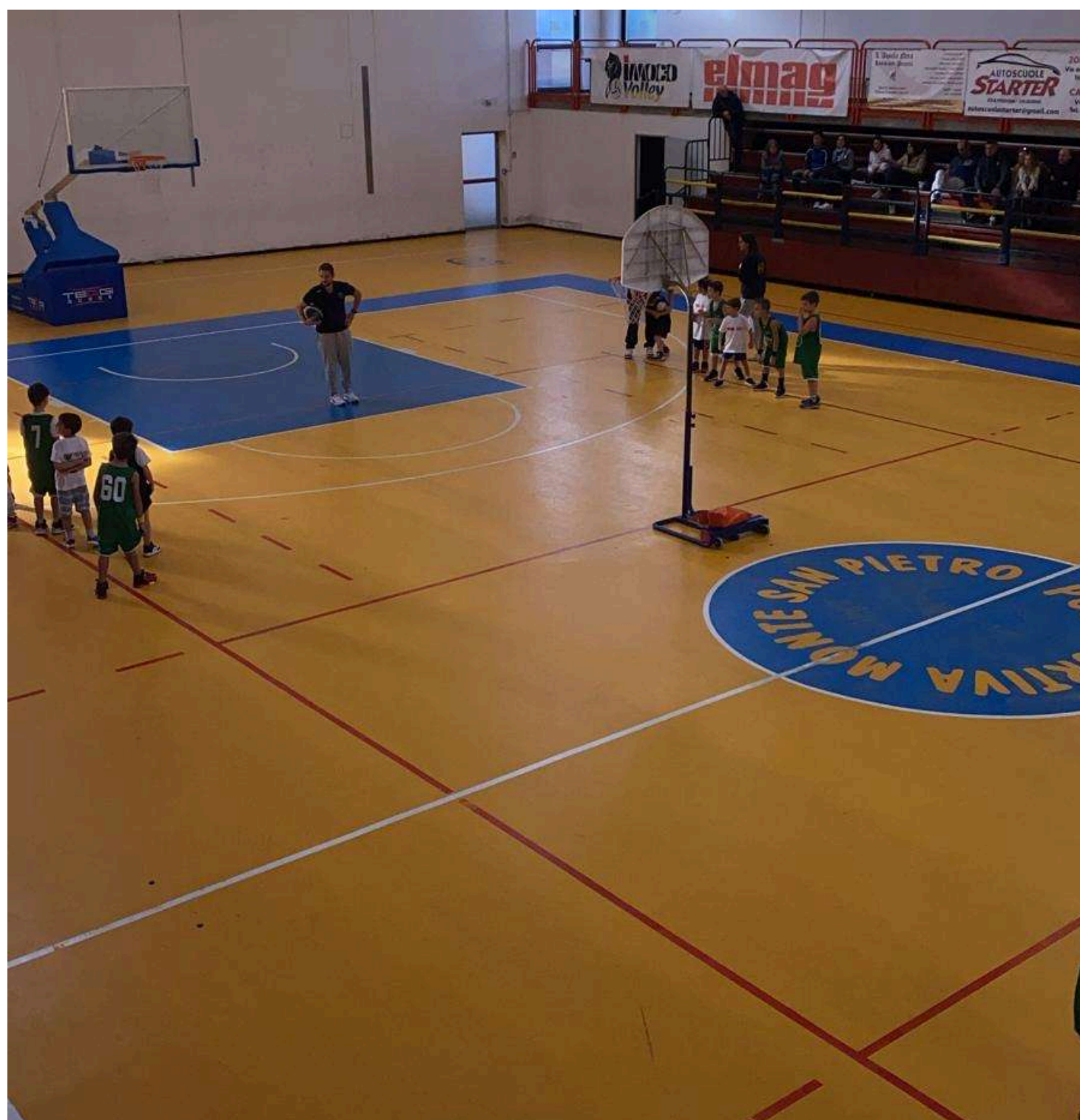
Immagine non comunicativa

La foto non ha alcun obiettivo. Piuttosto che una foto così, meglio non avere nulla.