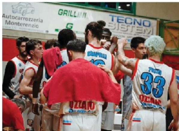
Il gruppo dei Flying Balls NFB OZZANO

Contro Reggio due punti d'oro anche con Sherif fuori causa