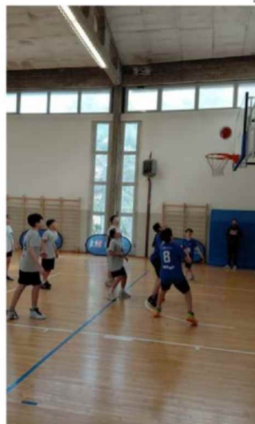
Un momento del torneo scolastico

L'iniziativa rappresenta un esempio concreto di collaborazione tra il mondo della scuola e quello dello sport, capace di promuovere valori fondamentali come il rispetto, la socialità e il benessere fisico.