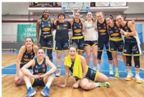
La Chemco festeggia il successo sulla Virtus Cesena