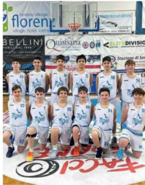
L'Under 13 della Vis 2008 che giocherà il torneo