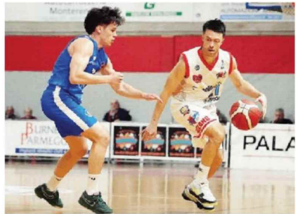
Un momento di Ozzano-Montebelluna