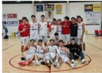
L'International Curti Under 19