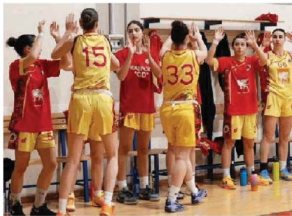
Le Peppers prima del match contro Puianello PEPERONCINO BASKET