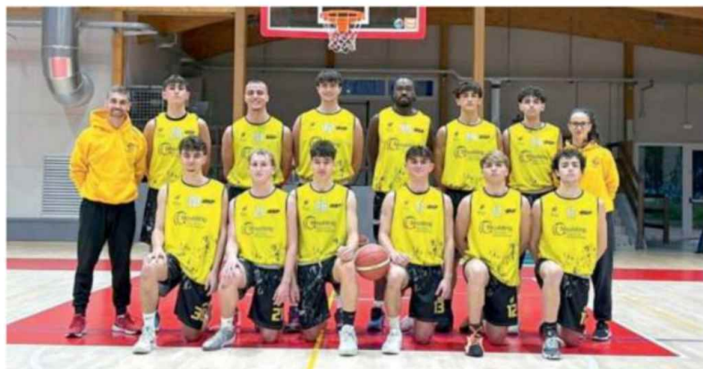
Vittoria per l'Under 19 Gold vignolese contro la Raggiosolaris

Trofeo Emilia-Romagna , ottavi di finale (gara secca): Arena Montecchio-Eagles Bk domani, Heron Bagnolo-Pol. VII Castelli Gazzolesi stasera, Vis Academy Persiceto-Virtus Medicina 54-68 (qual. Medicina), Matilde Bondeno-Salus Bo gioc.martedì, GS Riolo Terme-Pall.Titano RSM 62-67 (qual. Titano), Bellaria Bk-AICS Junior Bk Fo domani.