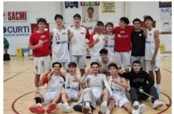
I ragazzi della squadra dell'Under 19 Gold dell'International Imola

A maggio scatterà infatti la fase playoff che coinvolgerà le migliori 64 formazioni d'Italia: tre turni dai quali usciranno le migliori otto che prenderanno parte alle finali nazionali in programma a Piazza Armerina dal 12 al 14 giugno.