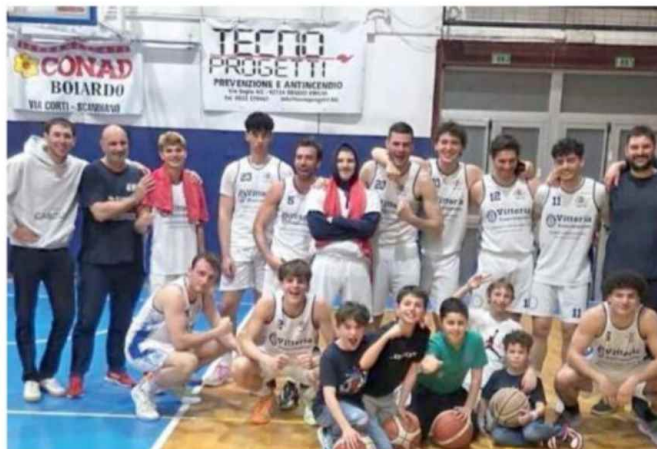
Nella foto a destra i reggiani della Jolly festeggiano con i tifosi dopo una vittoria in campionato

Classifica: Budrio 50, Novellara 44, Jolly 40, Basket Voltone, Reggiolo 36, Pol.Masi 32, Magik Parma, Cus Parma 30, Correggio 26, Parma Basket Project, Cento 24, Castelfranco Emilia 22, Stars Bologna 20, Castel San Pietro 18, Medolla 14, Pianoro 2. ●