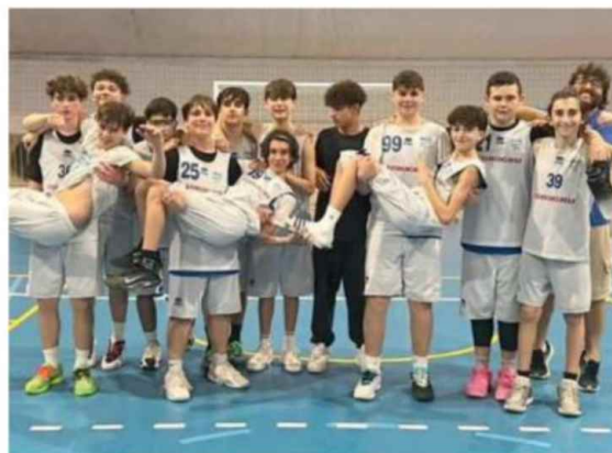
L'Under 14 Pgs Smile Formigine festeggia il passaggio contro Castellana