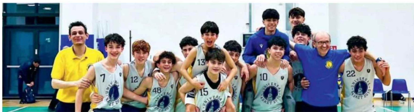
Nella foto l'Under 14 Gold Universal festeggia dopo il successo contro la Pallacanestro Reggiana che è valso ai modenesi anche l'aggancio al secondo posto in classifica