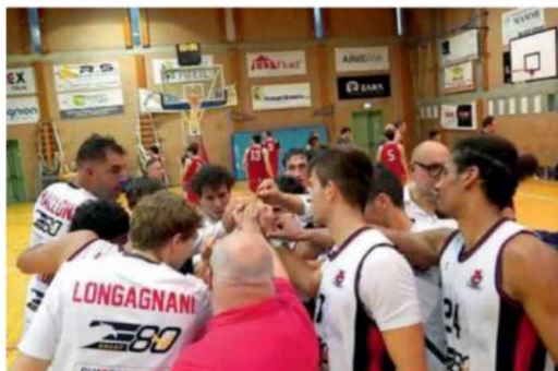
L'esultanza dei giocatori dell'E80 che hanno dominato la stagione Sotto, il gruppo squadra