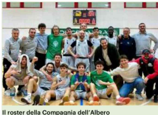
Il roster della Compagnia dell'Albero