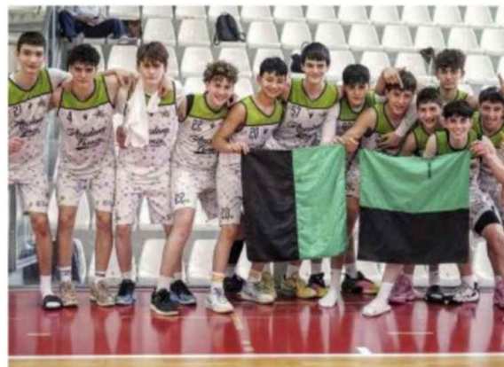
Under 15 Eccellenza Raggisolaris Academy