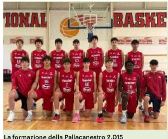
La formazione della Pallacanestro 2.015