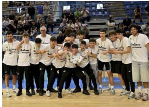
L'Under 15 Eccellenza della Raggisolaris Academy