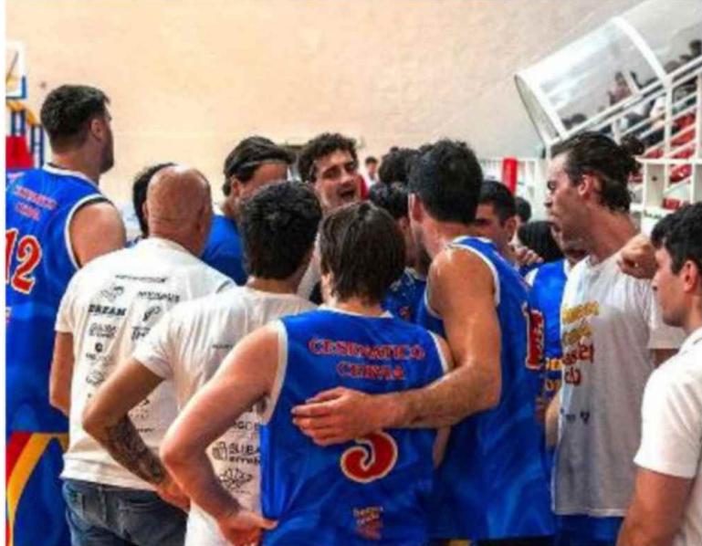
La festa al PalaCesenatico dove a sostenere la squadra la tribuna era gremita