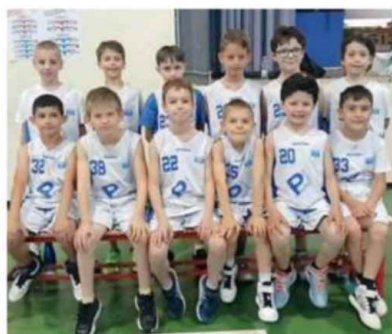
Le sei squadre protagoniste del torneo Minibasket disputato a Campo galliano