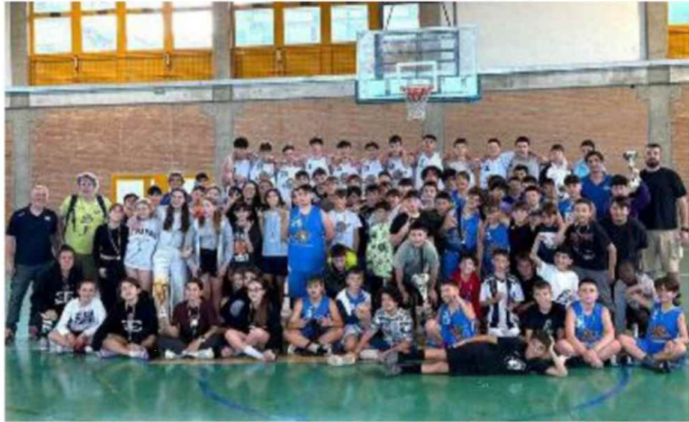
Il gruppo del Basket Cerviacesenatico al torneo di Vasto

Il Basket Cerviacesenatico ha vinto il torneo giovanile di Vasto nella categoria Under 15 maschile. In terra di Abruzzo c'è stata una grande partecipazione del Basket Cerviacesenatico, che ha portato ben 84 atleti più lo staff tecnico, per un totale di quasi cento persone, divisi in 7 squadre, che sono Under 15 Maschile, Under 14 Maschile, Under 13 con due squadre, Esordienti Maschile (formata dai ragazzini di prima media), Esordienti Femminile con le ragazze di prima media e la formazione degli Aquilotti costituita dai bambini che frequentano la quinta elementare. È stata una