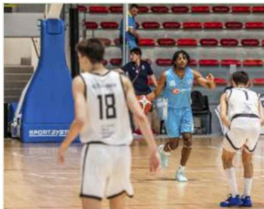
Prosegue il cammino tricolore della Vis under 19