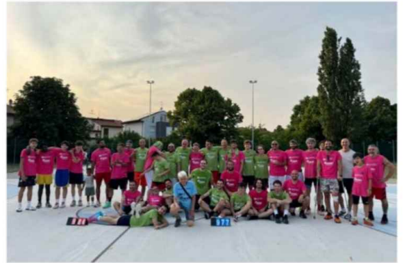
Un'immagine della scorsa edizione della 24 ore Marghe AllStar