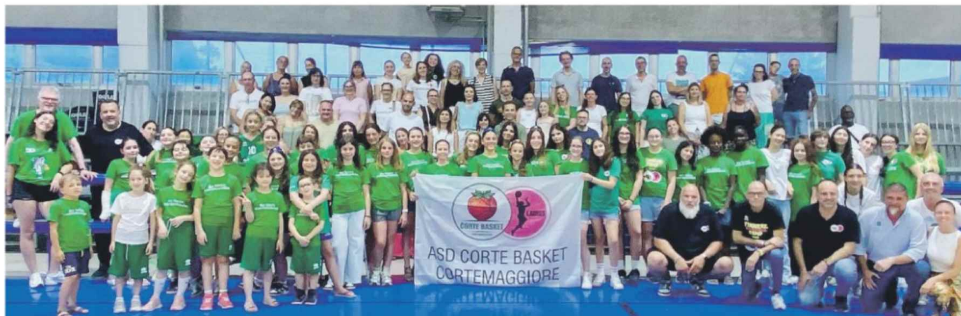
Foto di gruppo al termine della festa di fine stagione del Corte Basket al palazzetto dell'Iratenax